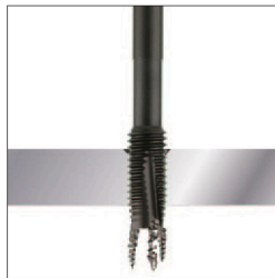
通り穴へのねじ立て