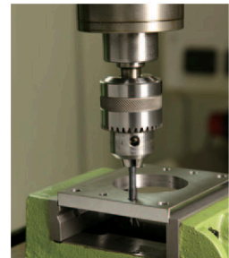
ボール盤での機械加工