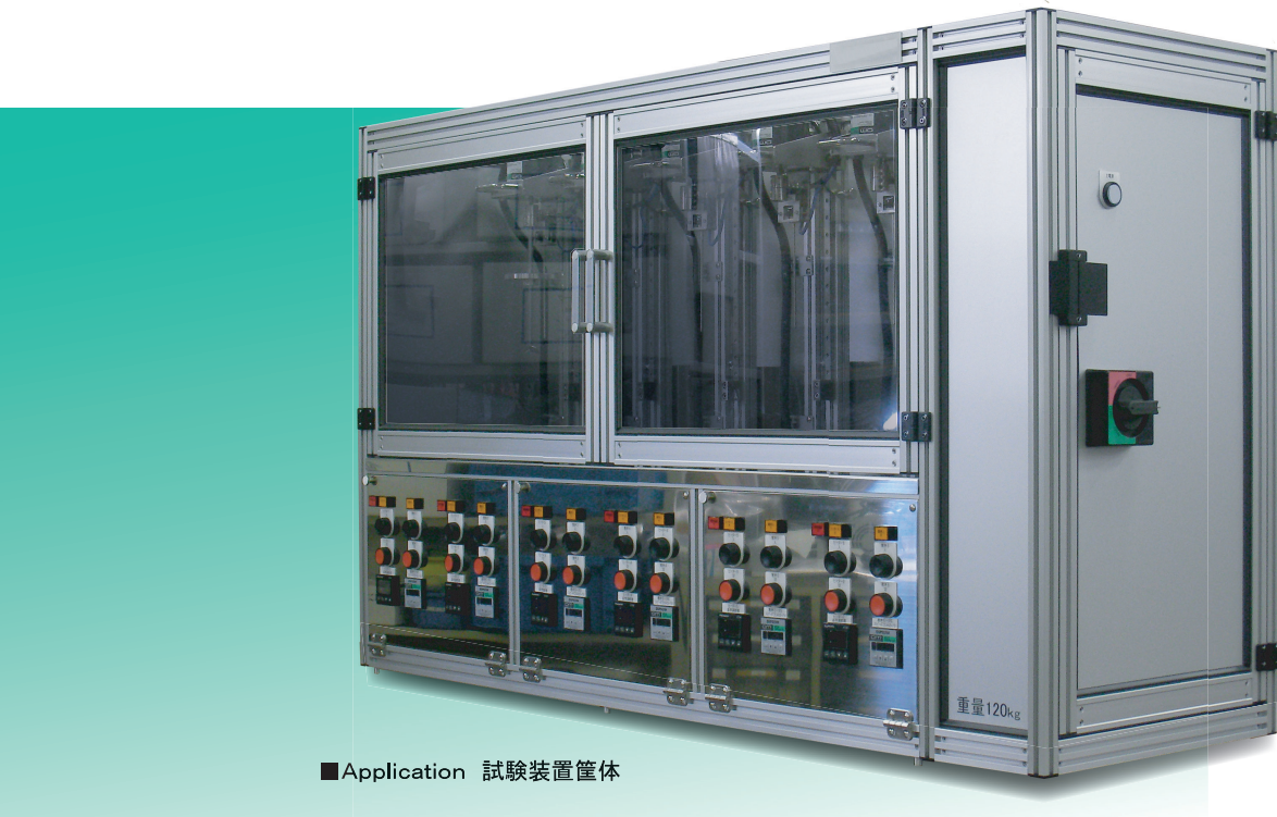
■ Application 試験装置筐体