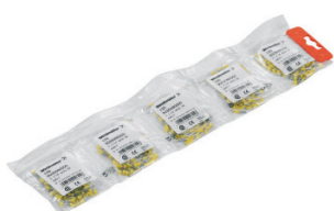
図5 小分けパック仕様

ワイドミュラーのフェールールは、通常の梱包仕様のほか、小分けのパック仕様もございます (図5参照)。また、数種類のフェールールが少量づつセットになったアソートタイプもございます (図6参照)。詳しくはお問い合わせください。