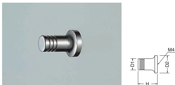
ST-70 ステンソフィアツマミ (ステンレス/4×28)