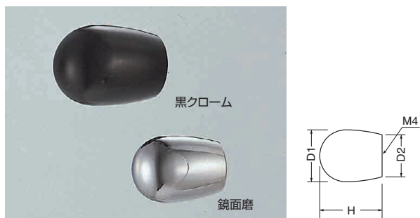
ST-68 ステン風船ツマミ (ステンレス/4×28)