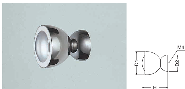
ST-71 ステンテイラーツマミ (ステンレス/4×28)