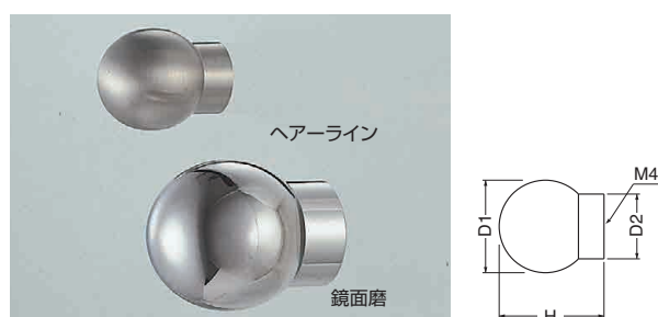
ST-73 ステンモナリザツマミ (ステンレス/4×28)