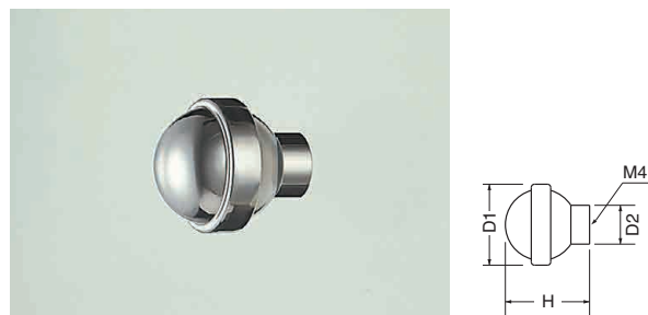
ST-74 ステンワールドツマミ (ステンレス/4×28)