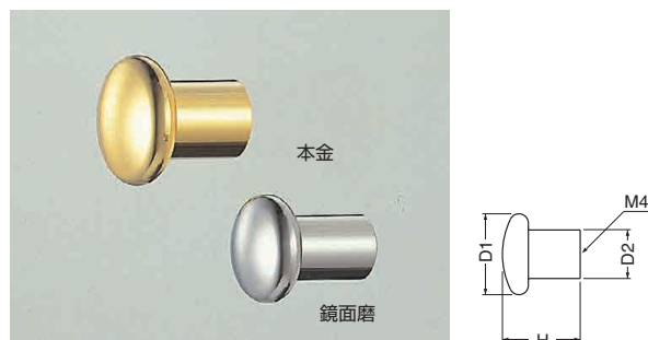
ST-72 ステンアメニティーツマミ (ステンレス/4×28)