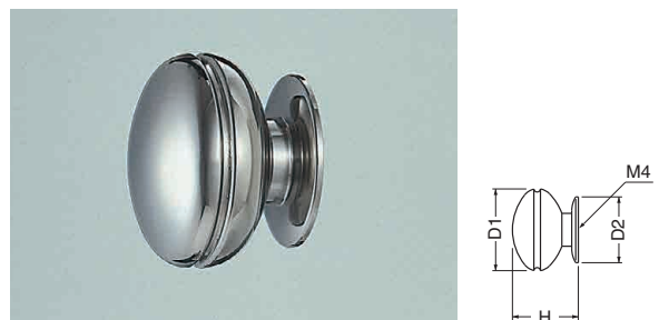
ST-75 ステンマックツマミ (ステンレス/4×28)