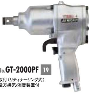
No. GT-2000PF 19 取付 (リティナーリング式) 後方排気/消音装置付