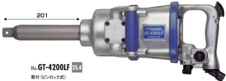
No. GT-4200LF 25.4 取付 (ピンロック式)