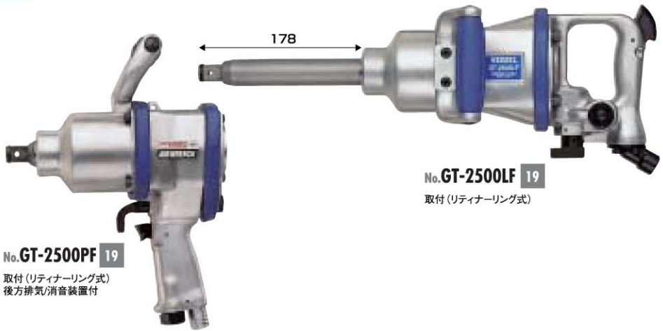
No. GT-2500PF 19 取付 (リティナーリング式) 後方排気/消音装置付