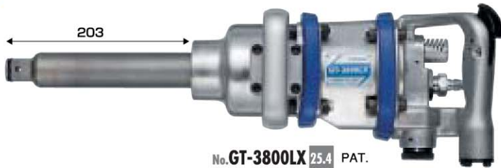
No. GT-3800LX 25.4 PAT. 取付 (リティナーリング式) 消音装置付