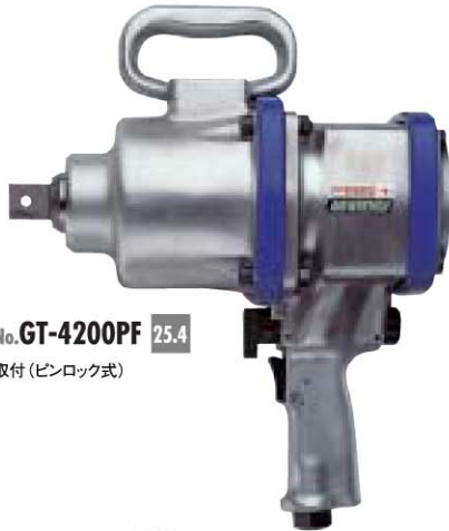
No. GT-4200PF 25.4 取付 (ピンロック式)