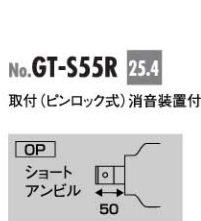
No. GT-S55R 25.4 取付 (ピンロック式) 消音装置付