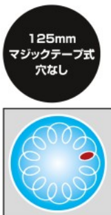
パッドがランダムに回転する、ダブルアクション

自動車の補修や鉄板、塗装面、FRP、木工等の研磨に最適。 手のひらサイズの軽量・小型で偏心運動&回転運動のダブルアクション。 偏心+回転によりサンディングするので削りムラが少なく研磨作業が可能です。 マジックテープ式パッド採用で、ペーパーやバフの交換が容易です。 レギュレーター装備でエアの流量を変化させ、回転数を調整可能です。