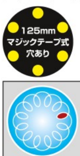
パッドがランダムに回転する、ダブルアクション

研磨粉を強力に吸い取る吸塵式 自動車の補修や鉄板、塗装面、FRP、木工等の研磨に最適。 手のひらサイズの軽量・小型で偏心運動&回転運動のダブルアクション。 偏心+回転によりサンディングするので削りムラが少なく研磨作業が可能です。 マジックテープ式パッド採用で、ペーパーやバフの交換が容易です。 レギュレーター装備でエアの流量を変化させ、回転数を調整可能です。