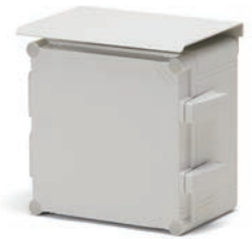
ルーフ SR-Rシリーズ P3-122