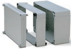
エクステンションフレーム OPCEシリーズ P3-116