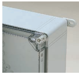
外部取付足 OFLシリーズ P3-116