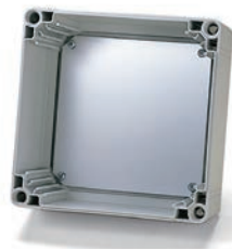
取付ベース OMPシリーズ P3-119~120