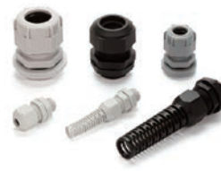
ケーブルグランド P5-61~76