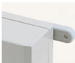
外部取付足 CKFシリーズ P1-174