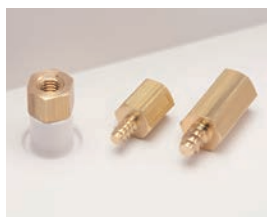
タッピングスペーサー TPSシリーズ P1-171