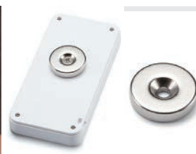
壁付マグネット NMGシリーズ P1-167~168