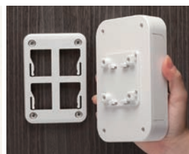
壁掛けブラケット WMシリーズ P1-166