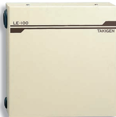
ตัวควบคุมเพิ่ม 3 ชุด Three-series additional controllers