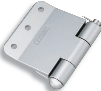
B-858N-4R (สำหรับด้านหลัง) (For rear gate)