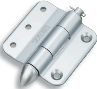
B-858-4S (สำหรับด้านข้าง) (For side gate)

Remarks • Product number of B-858-4R has changed to B-858N-4R