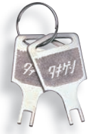
กุญแจ No.030 Key