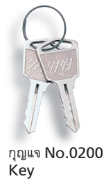
กุญแจ No.0200 Key