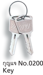
กุญแจ No.0200 Key