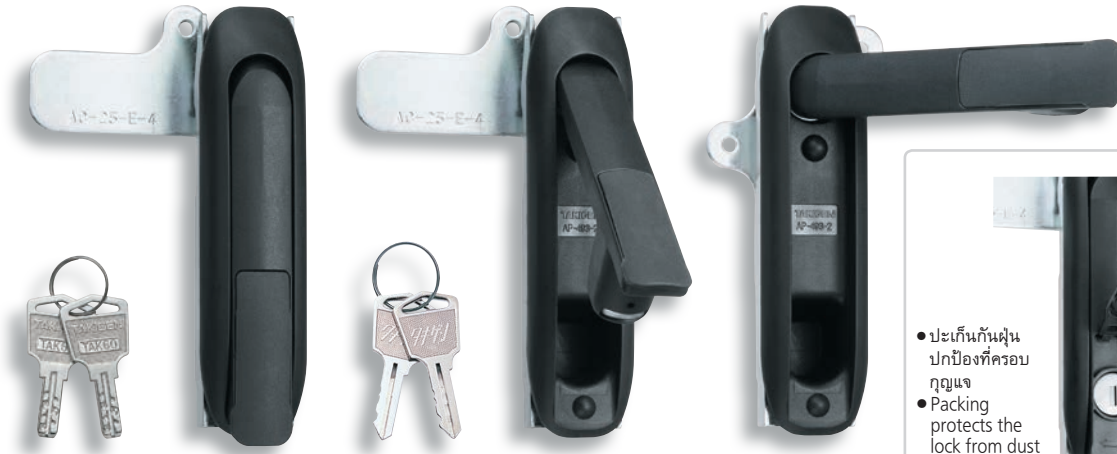
กุญแจ No.TAK60 Key

ปกป้องที่ครอบกุญแจด้วยฝาปิดฝุ่น Protects the lock from dust