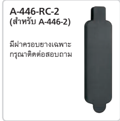
A-446-RC-2 (สำหรับ A-446-2)