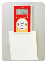
ペーパー クリップ 使用例