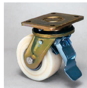
自在ストッパー付 LS-GSPO-125K-ST