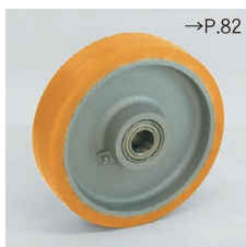
(LH用) GTHウレタン •スチールブッシュ入り (Blickle Extrathane®)