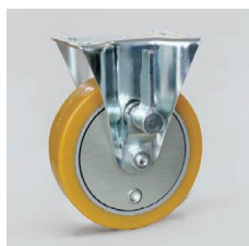
(BH-TB用) GTHウレタン (Blickle Extrathane®)