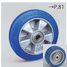
ALBSウレタン (LH/BH用) ● スチールブッシュ入 (Blickle Besthane® Soft)