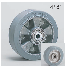
ALEV-SGゴム (SBR) ● 床面保護・車輪の跡がつかない ● スチールブッシュ入 (Blickle EsayRoll)