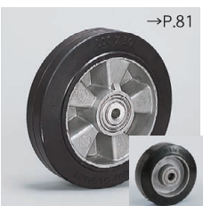
ALEVゴム (SBR) ● スチールブッシュ入 (Blickle EsayRoll)