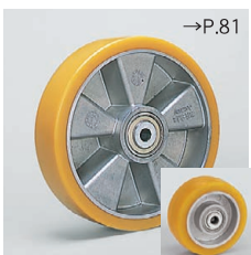
ALTHウレタン (LH/BH用) ● スチールブッシュ入 (Blickle Extrathane®)