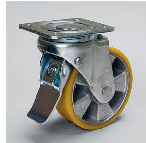
自在ストッパー付 LH-ALTH-200K-ST