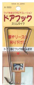
A-1003 ● 商品サイズ W:60×H:155×D:3mm

クリスマスリースやお正月の注連飾りを掛けるドアフック、ほうきや塵取りを整理するのに便利な樋フック。どちらも挟み込むだけの簡単フックです。