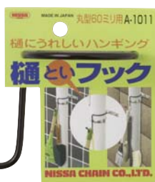
A-1011 ● 商品サイズ W:115×H:100×D:50mm