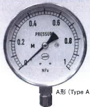
A形 (Type A)

高温流体の場合はゲージの1次側にサイホンをご使用下さい。 Please use this gauge with siphon at a time of high-temperature fluid