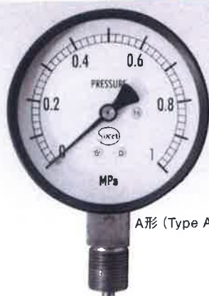
A形 (Type A)

配管設備、工場、ビル設備に最適な汎用型です。 Suitable for plumbing device, factory, building equipment