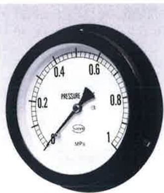
D形 (Type D)