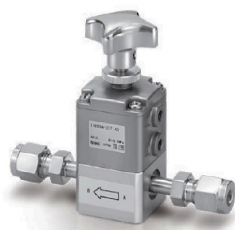
LVH20M-D07-AD ダブルフェルール継手