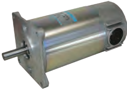
質量 Mass 4.0kg