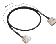
ストレートタイプ