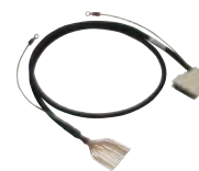
ライトアングルタイプ