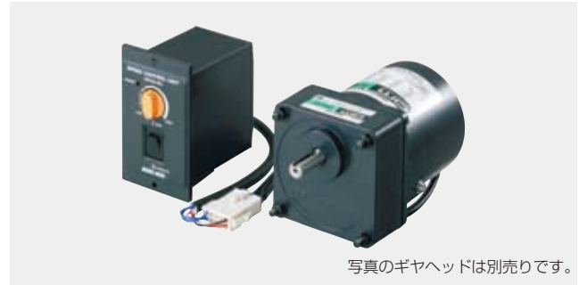
写真のギヤヘッドは別売りです。