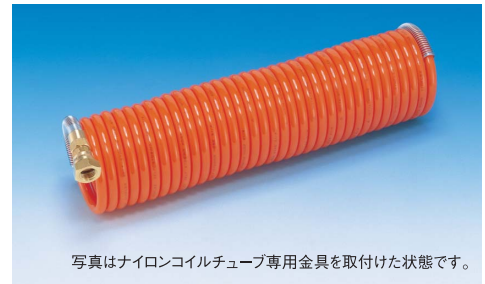
写真はナイロンコイルチューブ専用金具を取付けた状態です。