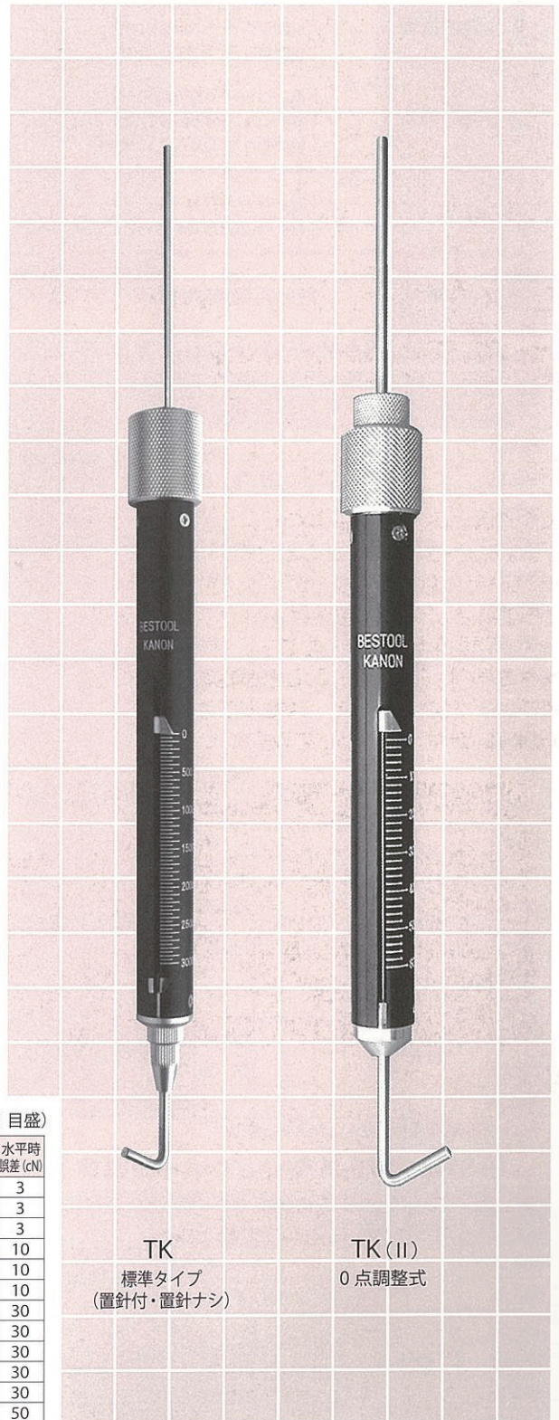
TK 標準タイプ (置針付・置針ナシ)