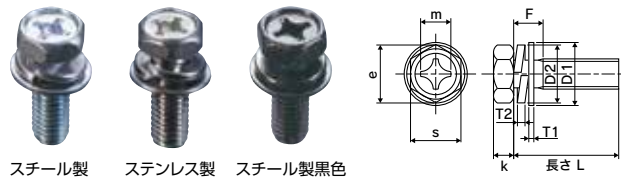
スチール製 ステンレス製 スチール製黒色