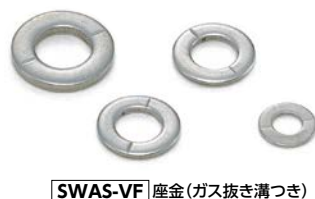
SWAS-VF 座金(ガス抜き溝つき)