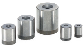
BB ボールボタン (P.496)