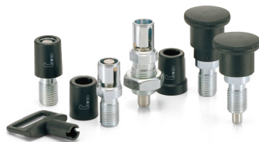
PCX インデックスプランジャ (P.446~P.447)