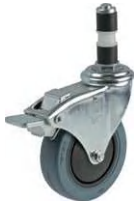
GMO-100 NRC W-5