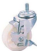
SH-100 NH S-2