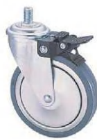
SMO-150 BM W-6