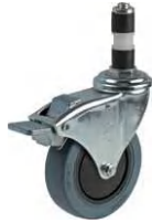
GMO-100 NRC W-5