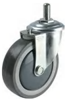
SMS-100 NTB S-8