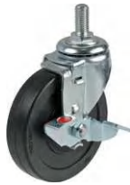
SEL-100 RL S-2