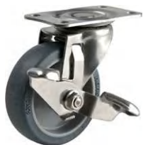
SU-TEL-65 TP S-2