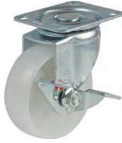
STC-75 NM S-1