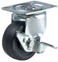
STC-50 EM S-1

▶▶ STC 自在 S-1・S-2ストッパー 50-75mm / S-1、S-2ストッパーは車輪の回転を止めるストッパーです。