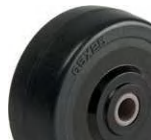
EM (50mm, 65mm)