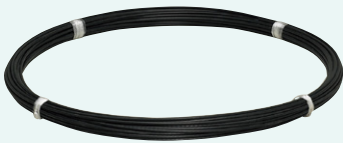
亜鉛めっき鋼より線