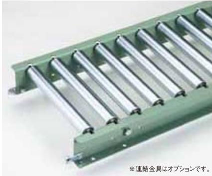
※連結金具はオプションです。