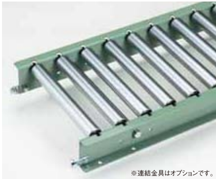
※連結金具はオプションです。