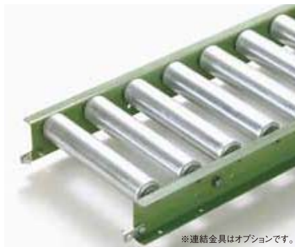
※連結金具はオプションです。