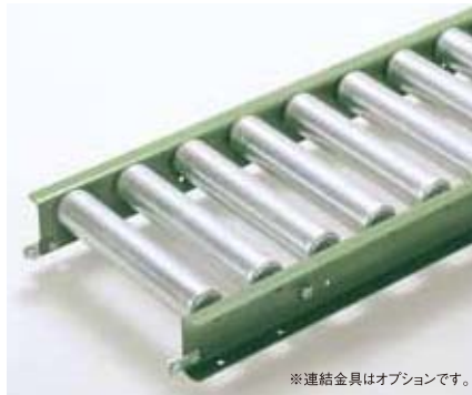
※連結金具はオプションです。