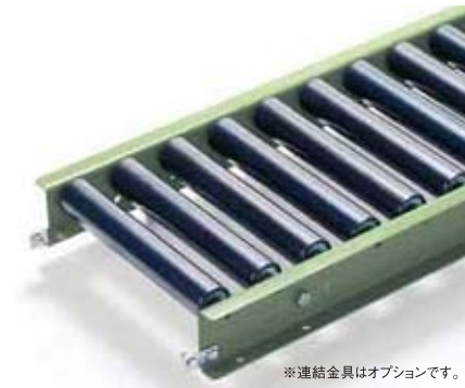
※連結金具はオプションです。