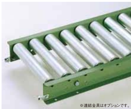
※連結金具はオプションです。