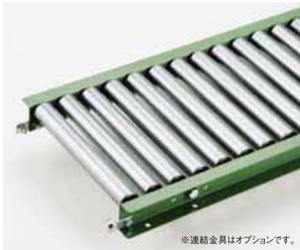
※連結金具はオプションです。