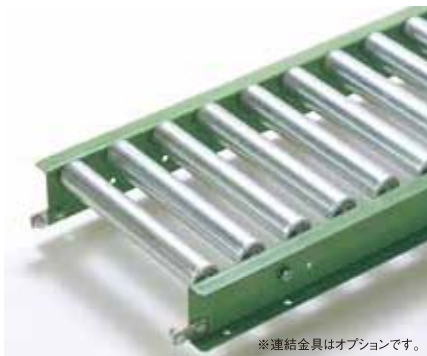
※連結金具はオプションです。