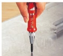
※ 修理対象外品です。