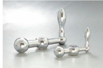
TH-N + AS