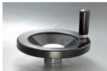
Y-N + ER