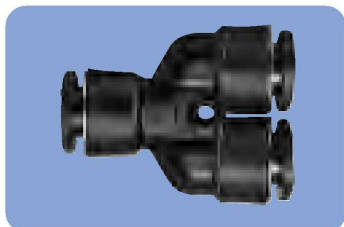
ユニオン Y/UNION Y