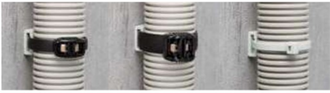
幅 12.7mm までのインシュロックタイ・エンドレスタイの併用が可能です。