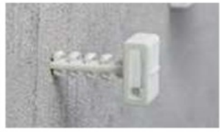
下穴を開けて指で押し込むだけでしっかり固定