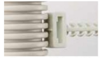
PF管をしっかりと固定するズレ防止のリップ付き