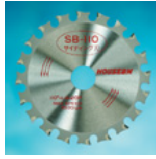
SBタイプ サイディング グワ