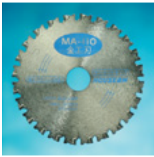
MAタイプ 金工刃 (サーメット)