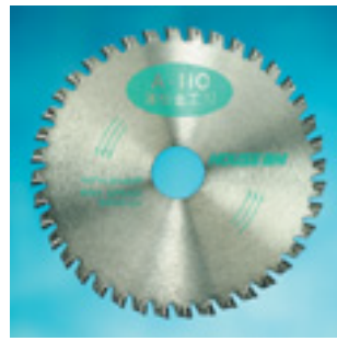
Aタイプ 薄板金工刃