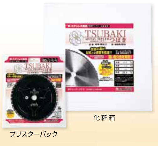
ブリストアパック