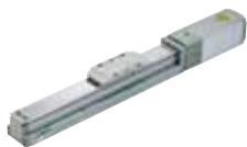
EBS-M シリーズ (カタログ No.CC-1422)