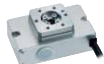
FGRC シリーズ (29 ページ)

※ ノイズフィルタ、サージプロテクタ、フェライトコアの設置、配線方法については、取扱説明書を参照ください。